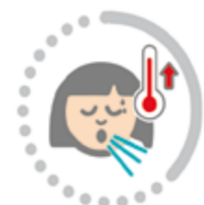
Fiebre y tos