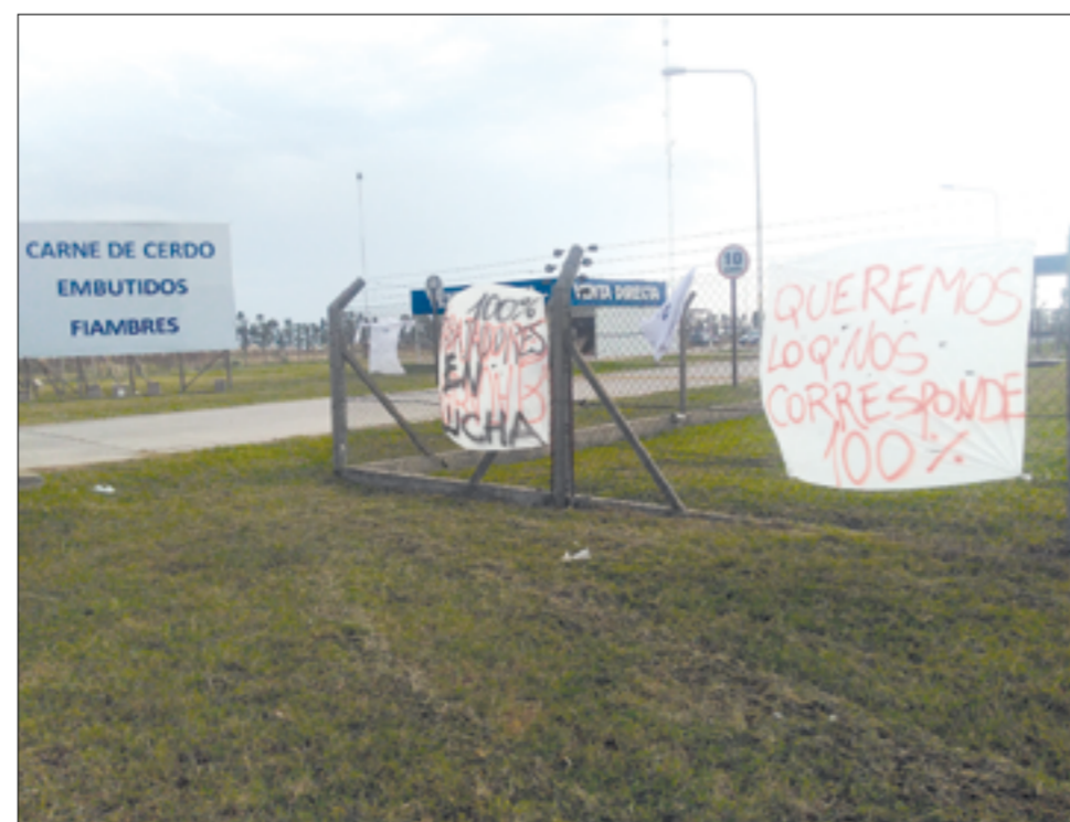
Este fin de semana cortarán la entrada de las plantas frigoríficas.