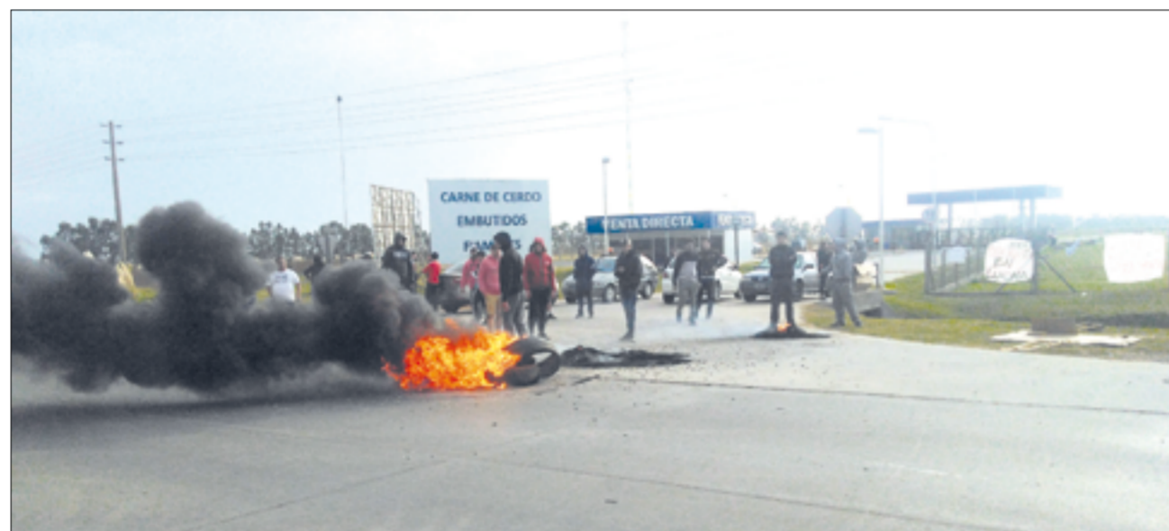
El pasado martes los empleados suspendidos de Cabaña Argentina cortaron la Ruta 6 en la entrada de la empresa.

El artículo 247 de la Ley de Contrato de Trabajo (LCT) establece que “En los casos en que el despido fuese dispuesto por causa