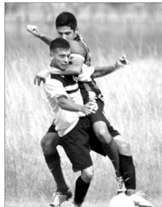
No es una clase de defensa personal, es un partido de fútbol entre Camioneros e Inter.

El segundo compromiso del año tendrá lugar el 5 de abril, ocasión en la que se disputará una fecha especial con pilotos Invitados como siempre en el dibujo narvarrense.