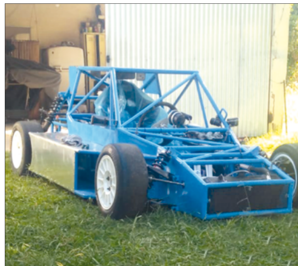
El auto de Iparraguirre dejó de lado el blanco de 2019 optando por un celeste pleno.

En esta ocasión APAC 1.4 recurrirá al circuito chico sin chicana para la que será la primera competencia de la trigésima quinta temporada de la divisional.