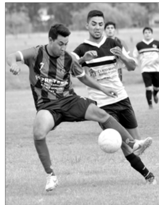
Camioneros goleó a Inter en el choque disputado en el primer turno.