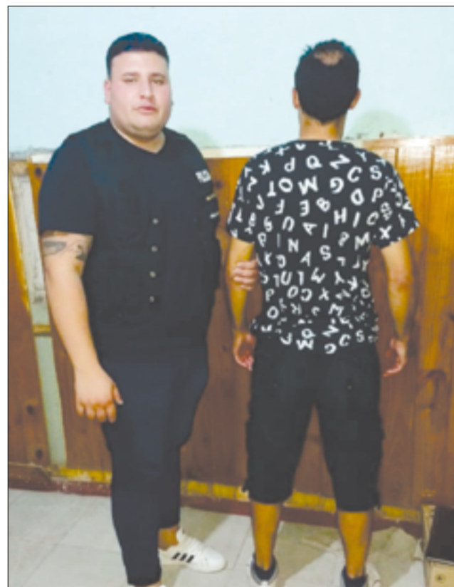
Luego de intensificar la búsqueda dieron con el buscado por la Fiscalía 2.

La policía aprehendió en la tarde del lunes 9 a un hombre de 44 años en nuestra ciudad, acusado de 'amenazas agravadas en el contexto de violencia familiar' por querer agredir a su pareja, informaron fuentes oficiales a este semanario. El hecho tuvo lugar en una vivienda de Güemes al 200, a la que acudió personal policial tras una denuncia que alertaba de una situación violenta. En el lugar los uniformados se encontraron con el hombre sospechoso, de ocupación empleado, y además secuestraron una escopeta calibre 16, marca Amsco. Notificada la fiscalía 1 de Cañuelas del procedimiento, se efectuó la liberación del sujeto.