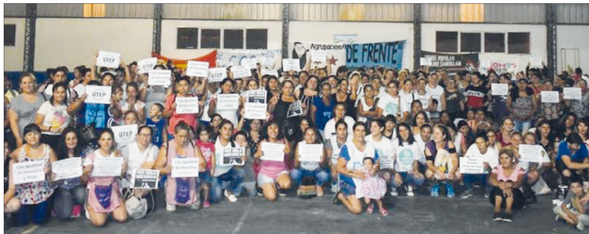
Mujeres trabajadoras en el Polideportivo de Máximo Paz.