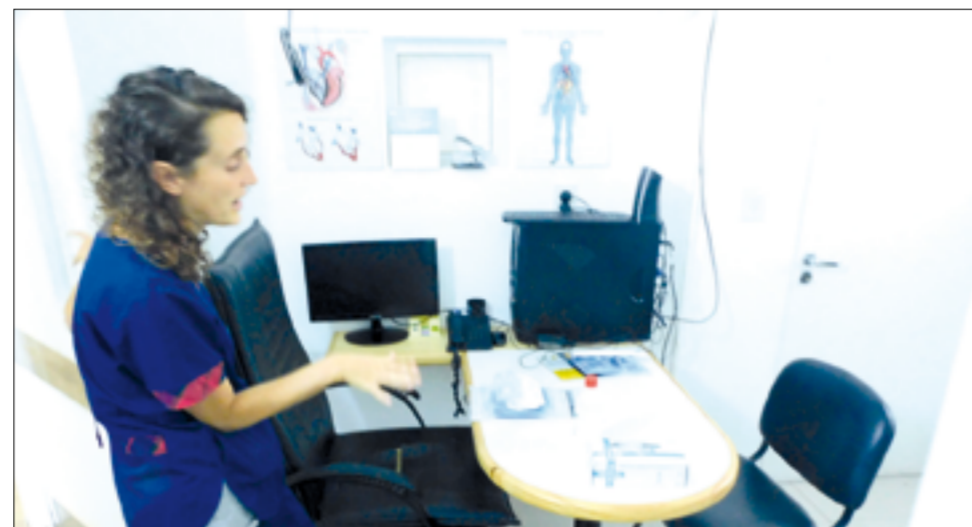
El consultorio de prevención del Club de Campo La Martona fue adaptado con un aislamiento ante algún presunto caso.

"El evento con nuestro socio nos llegó luego de lanzado el material de difusión institucional a la gente del club y de inmediato reforzamos las medidas de higiene, como las sanitarias y de la comunicación del caso. Se trata de un socio, no residente de La Martona, de más de 40 años, que regresó de Estados Unidos el 29 de febrero. Vino directamente