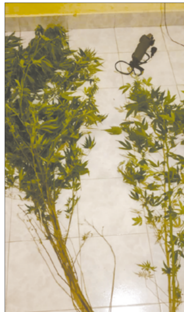
Un par de plantas de marihuana se sumó a la investigación.

casco. Para llevar adelante el escruche habrían usado una motocicleta. Efectuada la denuncia y en base a las tareas del destacamento de Alejandro Petión, se solicitaron los allanamientos en domicilios donde estarían las cosas robadas. Durante los procedimientos se encontraron con dos plantas de marihuana de más de un metro de altura y otra de menor dimensión. El hallazgo produjo una causa por 'Tenencia para consumo y plantación'. En el domicilio del hombre se halló una amoladora y las plantas mencionadas, pero ninguna persona. En tanto que en el otro registro el resultado fue negativo.