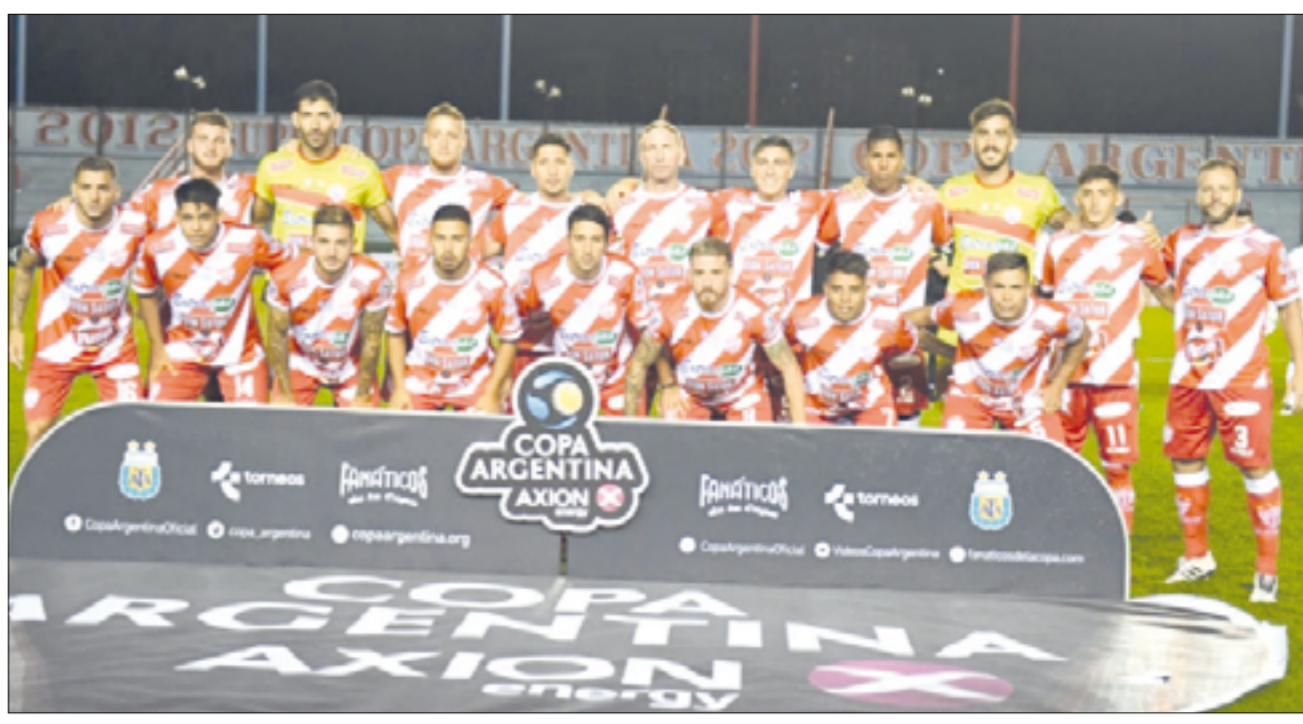
El Rojo posa en la previa al inicio del partido.