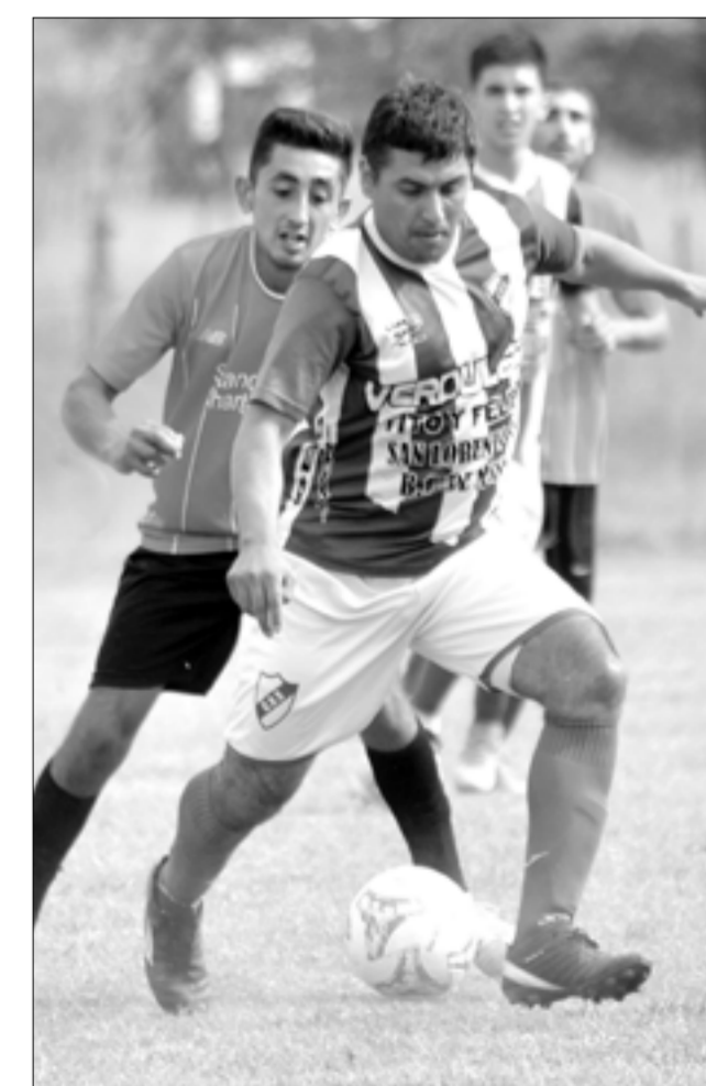
Sarmiento se impuso por 1-0.