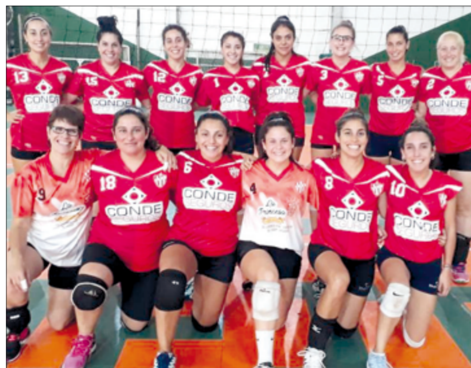
La Primera División del CFC obtuvo el segundo lugar en el Abierto de la LiVoSur.

Entre hoy y mañana se jugará un nuevo Abierto de la LiVoSur aunque en esta ocasión destinado a las Sub 18.