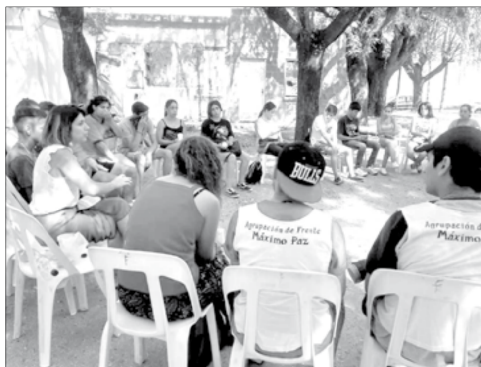
Una masiva participación de adolescentes convocó los talleres de la Dirección de Juventud municipal.

Las autoridades educativas intervinieron llevando calma a la comunidad recalando que es un caso sospechoso, estando a la espera de los resultados de los análisis de práctica realizados y que el dengue no se transmite de persona a persona, ya que el vector es el mosquito. Al respecto señalaron que se procedió a la fumigación del establecimiento y las manzanas circundantes como así también el domicilio de la docente. Además, instaron a los padres a continuar con la rutina escolar habiéndose tomado todos los recaudos del caso.