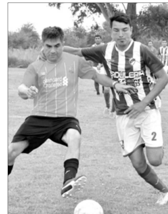
Futbolistas de Sarmiento-Liverpool parecen abrazarse en esta instantánea del domingo.