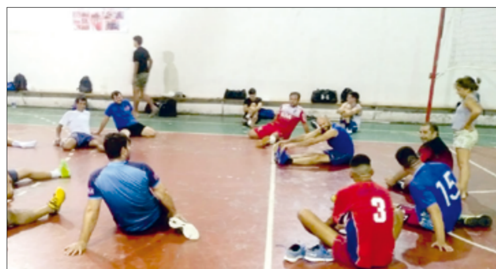
Cañuelas va por un nuevo desafío en la Federación Metropolitana.

El Tambero tendrá su bautismo de fuego en este torneo el próximo viernes 20, oportunidad donde visitará a Estudiantes en Ramos Mejía.