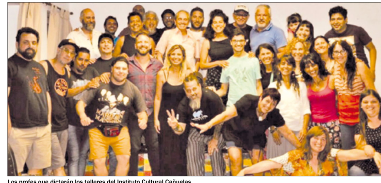
Los profes que dictarán los talleres del Instituto Cultural Cañuelas.