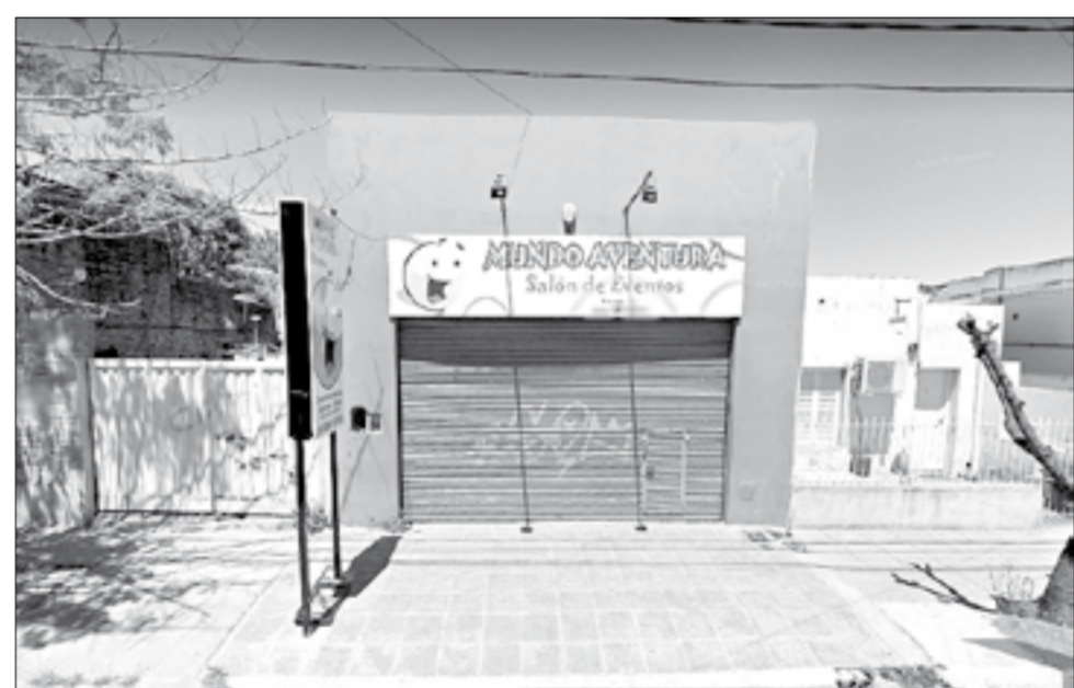
Sin festejos, con las puertas cerradas, los salones infantiles al borde de la ruina.

Pasados dos meses de no poder abrir las puertas, "seguimos teniendo el alquiler del local, el servicio de emergencia, Aycapif, Sadaic, luz, gas. Todos costos que hacen muy complicado. Desde el domingo 15 de marzo que bajamos el disyuntor del salón". Y sobre los gastos detalló que "no pasaron a medir. Cobraron un proporcional de luz y entonces vino un monto como el anterior.