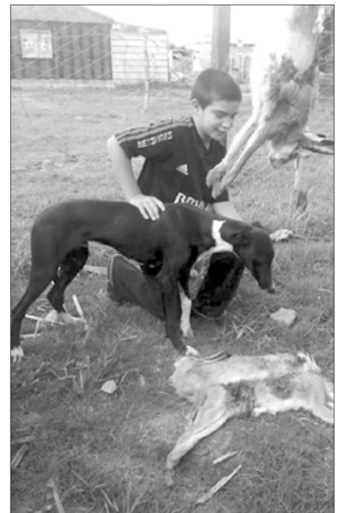
El joven cañuelense a los 9 años con las presas de la caza.