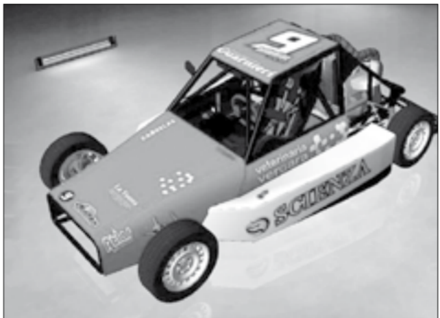
En el mundo virtual el auto de Girotti es rojo y blanco.