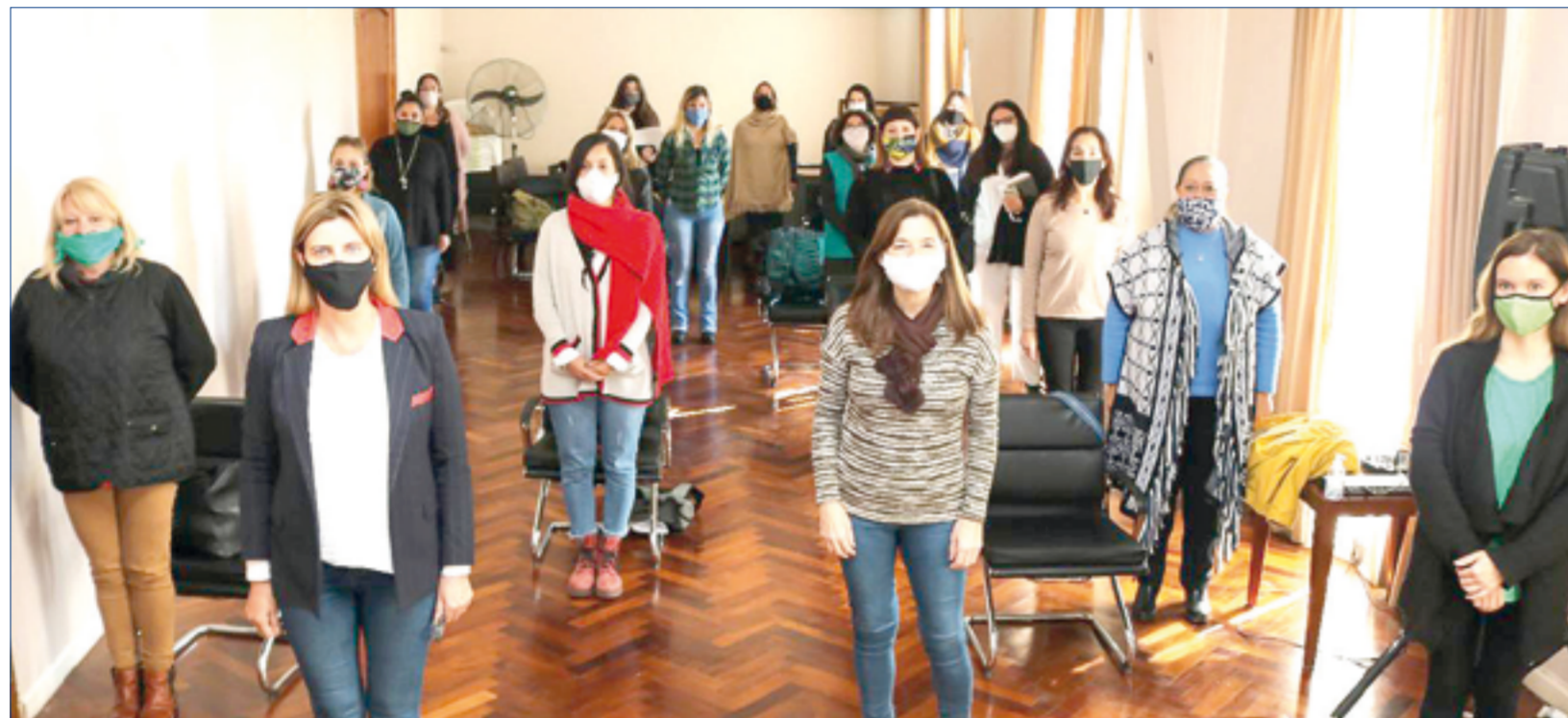
Se presentó un nuevo dispositivo de geolocalización para prevenir la violencia de género

La ministra Estela Díaz se refirió a la voluntad política del gobernador de la provincia de Buenos Aires, Axel Kicillof, de sumar un ministerio de las Mujeres como así también la de la intendenta municipal en darle jerarquía de secretaria