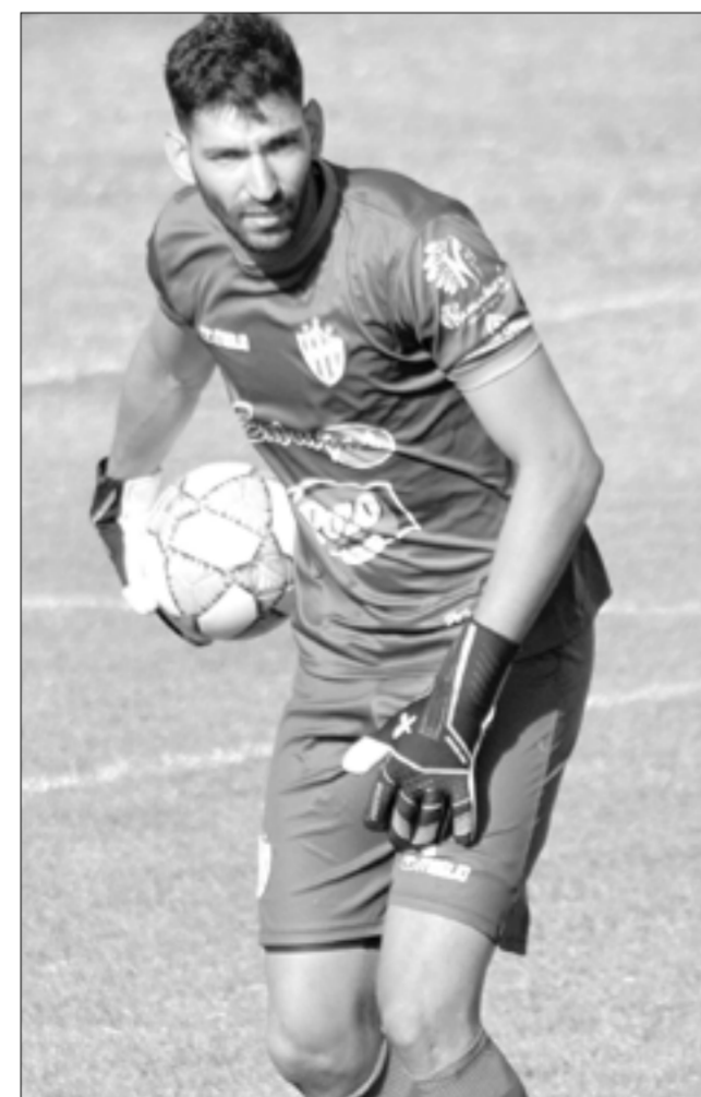
Brambati: "Siempre busco hacer algo diferente para pasar el tiempo en esta cuarentena".