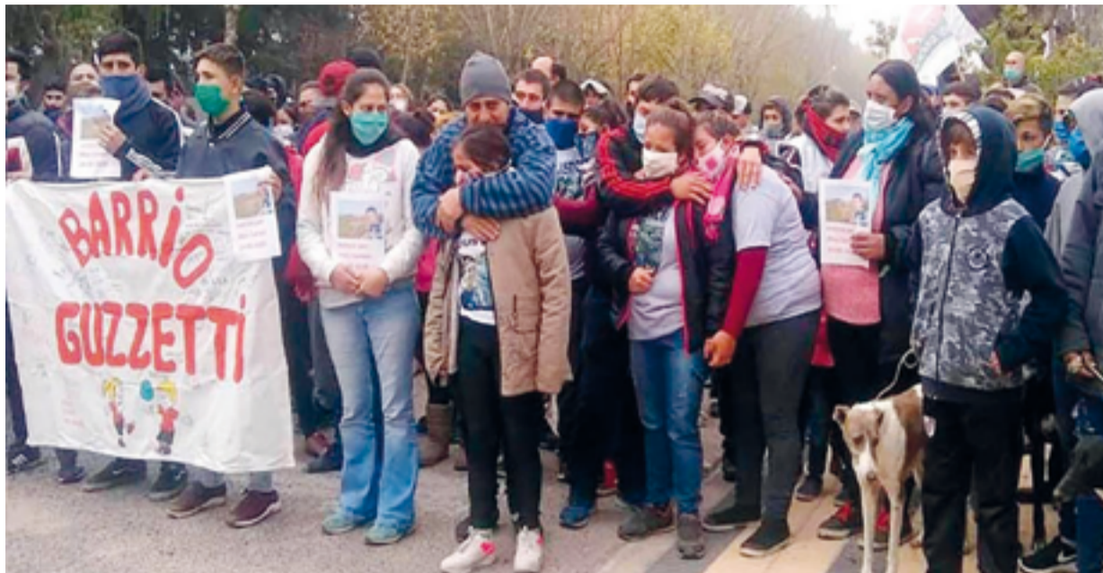
Sus restos fueron inhumados el martes con un importante cortejo hasta el Cementerio Municipal.