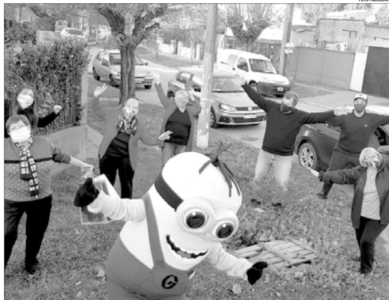
La nueva modalidad es a través de fiestas virtuales y entrega de un muñeco de regalo en la puerta.

La falta de certeza hizo que reprogramen los eventos. "Tenemos clientes que optaron para reprogramar el cumple en marzo. Por suerte la gente comprende lo que está pasando y nos espera. No tuvimos que devolver algún pago del cumpleaños. No vinieron a pedirlo. Lo postergamos y congelamos el precio de ahora para más adelante. Pero ante esta situación tenemos que reinventarnos", analizó el comerciante, que además es profesor de Educación Física. "Es una situación angustiante, de incertidumbre. Tengo todo y no puedo reabrir, lo mismo que para volver a la escuela con las clases como docente".