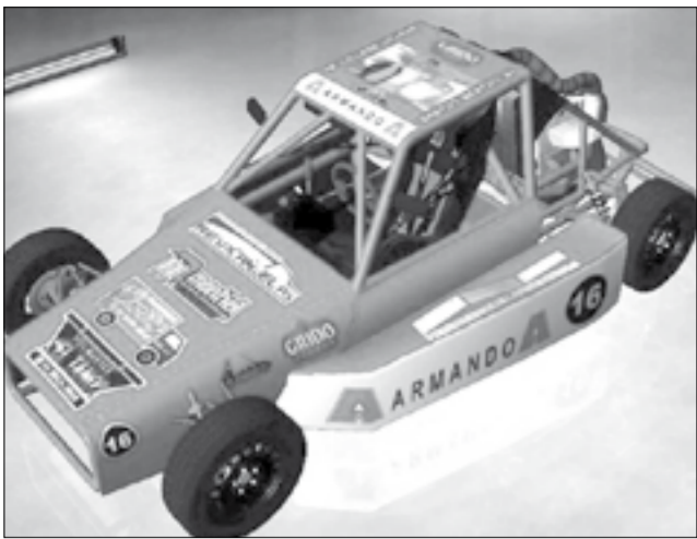
Bertoni volverá a Areneros 1400 aunque de manera virtual.