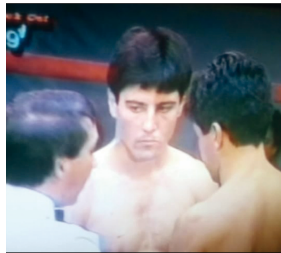
El cañuelense en una de los tantos combates televisados por Canal 9.