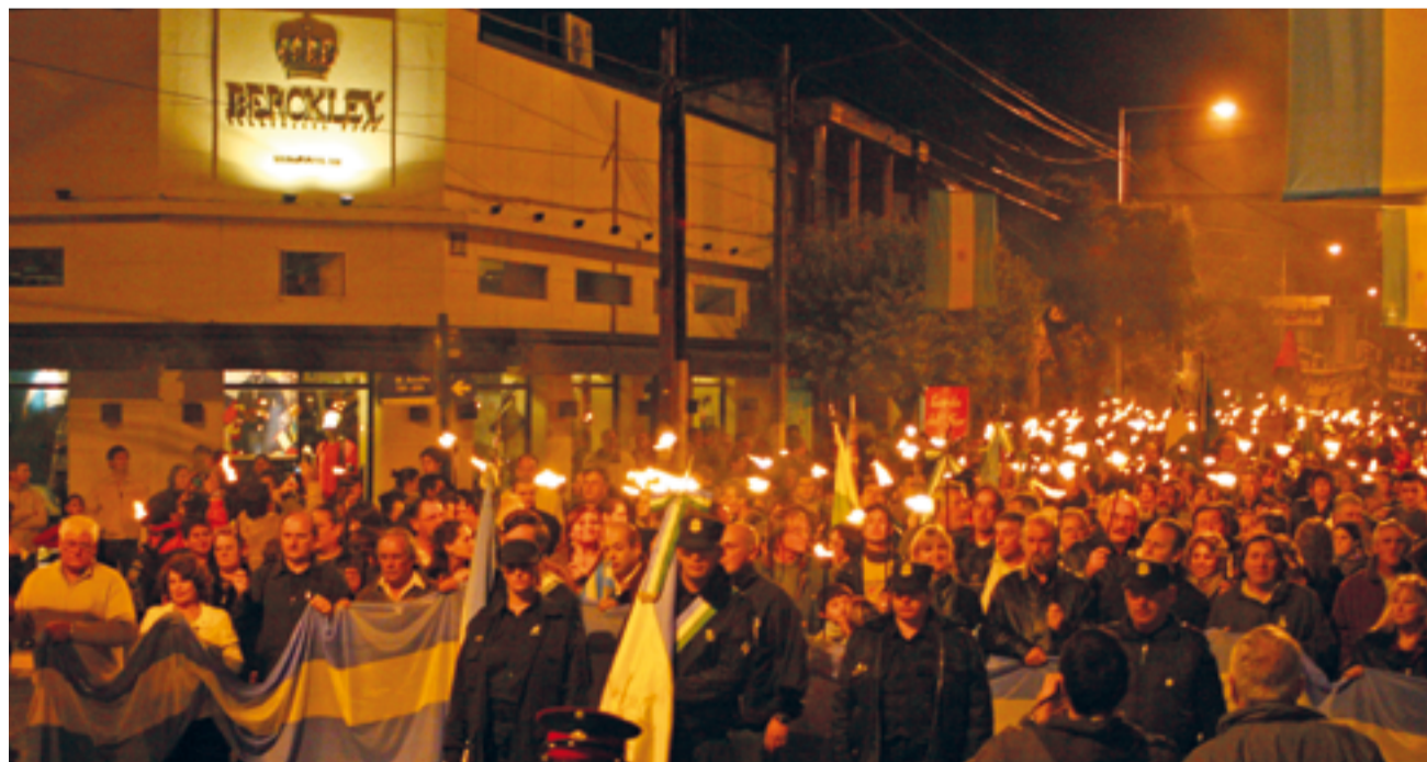
La 'Caravana del Bicentenario' con 200 antorchas por la avenida Libertad.

● Se presentaba el Ford Falcon del '70. Un aviso publicitario explicaba las bondades de una nueva versión del popular automóvil argentino. Se describían las distintas líneas de los modelos del vehículo: Sedan Futura, De Luxe, Standard Taxi y las rurales De Luxe y Standard.