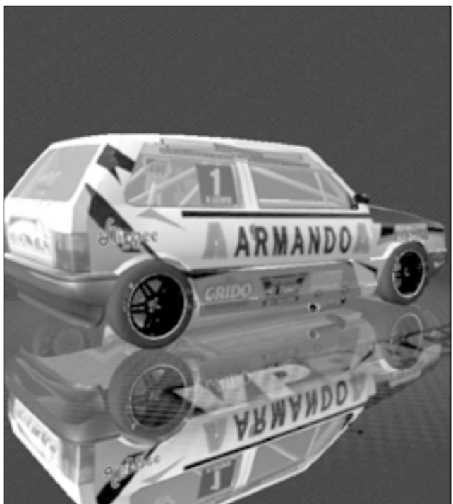
En el mundo virtual Latapié corre en cinco categorías diferentes.