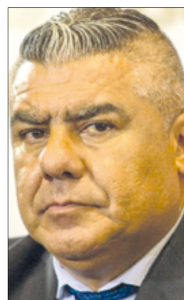
Claudio 'Chiqui' Tapia.

cobrarán el ochenta y el setenta y cinco por ciento en junio bajo el concepto de "no remunerativos" y calculado sobre el salario neto que se hubiera devengado por prestar servicios normalmente.