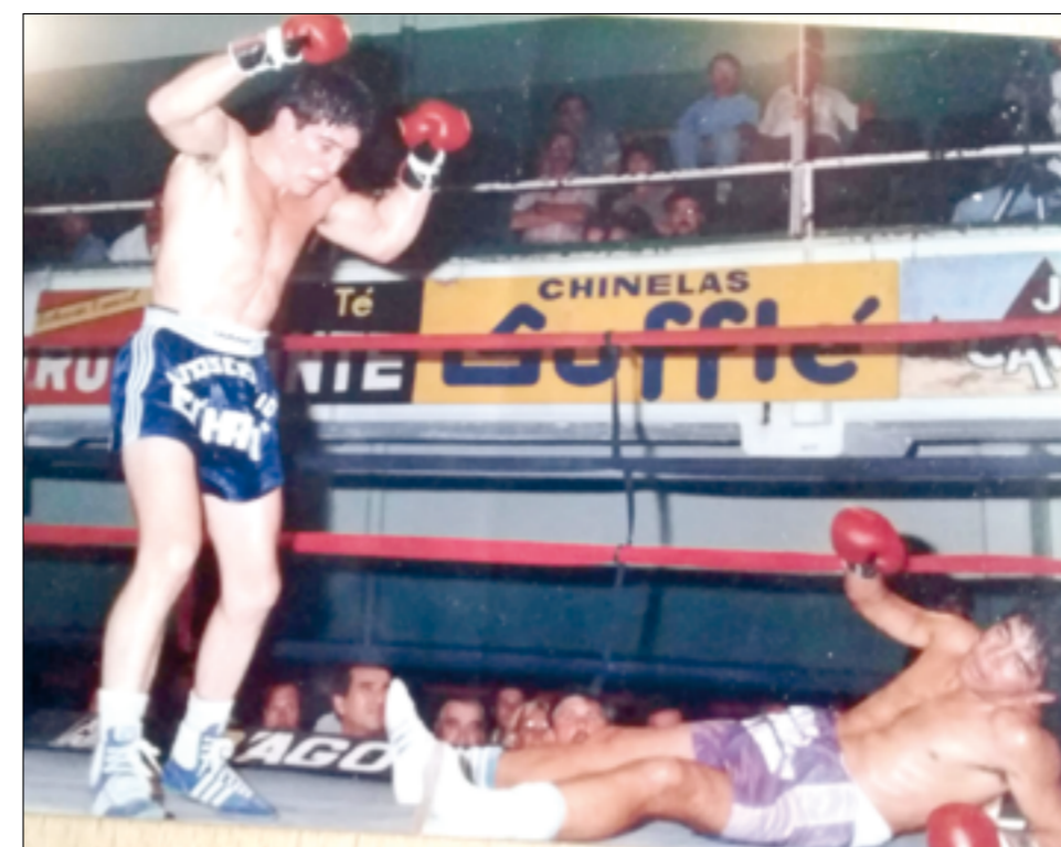
Los brazos en alto del cañuelense lo dicen todo: otro triunfo por la vía rápida.