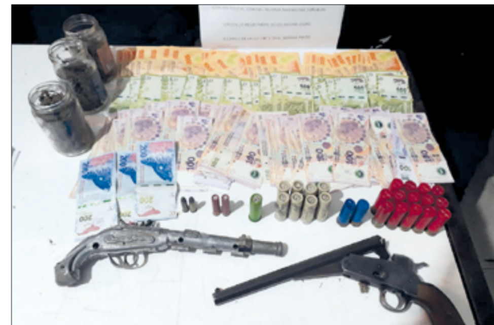
En el barrio Altos Verdes, de Máximo Paz, se llevó el procedimiento por una investigación de robo y amenazas.

calibre 38, consignó una fuente del caso. Asimismo, el vocero oficial dijo que hallaron en tres frascos de mermelada flores y picadura de marihuana, totalizando un peso de 56 gramos de esa sustancia y, por otra parte, la suma de más de cien mil pesos. El procedimiento, a instancias del Juzgado de Garantías 8 de La Plata, con asiento en Cañuelas, en comunicación con la Fiscalía 2 Cañuelas, dio orden de iniciar actuaciones caratuladas como 'tenencia ilegal de estupefacientes'. En el operativo, donde participó el personal de la Comisaría 2 de Máximo Paz y la Policía Comunal, no se adoptaron medidas para con los moradores de la vivienda, los que fueron identificados.