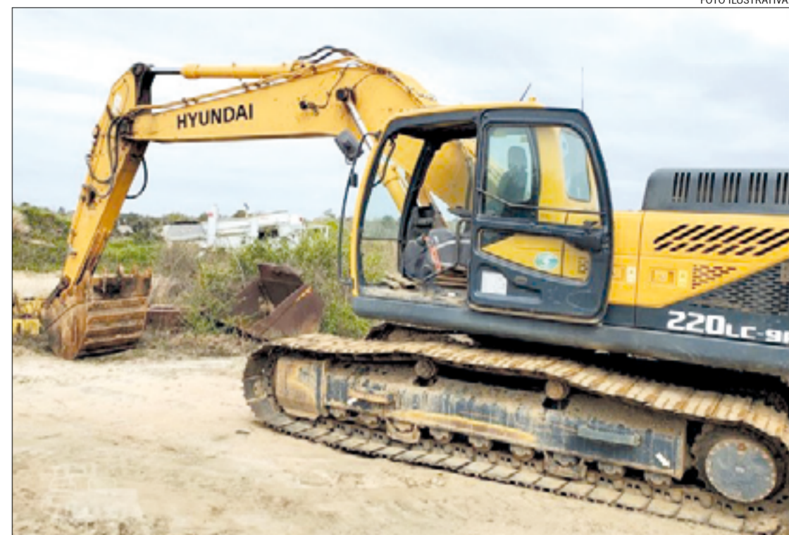
Una excavadora sobre orugas falta de la empresa Casella S.A. que prestaba servicios en el distrito.

yeron sus damnificados que se pusieron en contacto con este medio. El robo no es el primero, en otras ocasiones ingresaron al propio galpón y se fueron con caños. Es una máquina marca Hyundai R22-95, amarilla, motor 76004851, que venía desde hacía meses llevando tareas en obras de desagüe cloacal en la ciudad y que desde hace un tiempo suspendieron sus planes. Se trata de 20 toneladas el rodado sustraído y para el cual se usó un carretón y dos baterías. Además, contaron con el apoyo de una camioneta y de un auto. Estos datos fueron también recogidos por los responsables de la máquina que pertenece a la empresa Casella S.A. Quienes tengan datos para aportar puede comunicarse al correo electrónico: danielradesca@casellasa.com