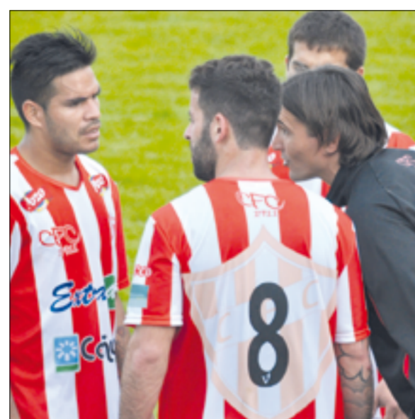
Martínez dirigiendo a 'El Rojo' en 2016.

Dicho acuerdo habilita además a realizar rebajas escalonadas en los sueldos de esos trabajadores durante un período de noventa días por lo que, tras cobrar el cien por cien del salario en abril, en mayo