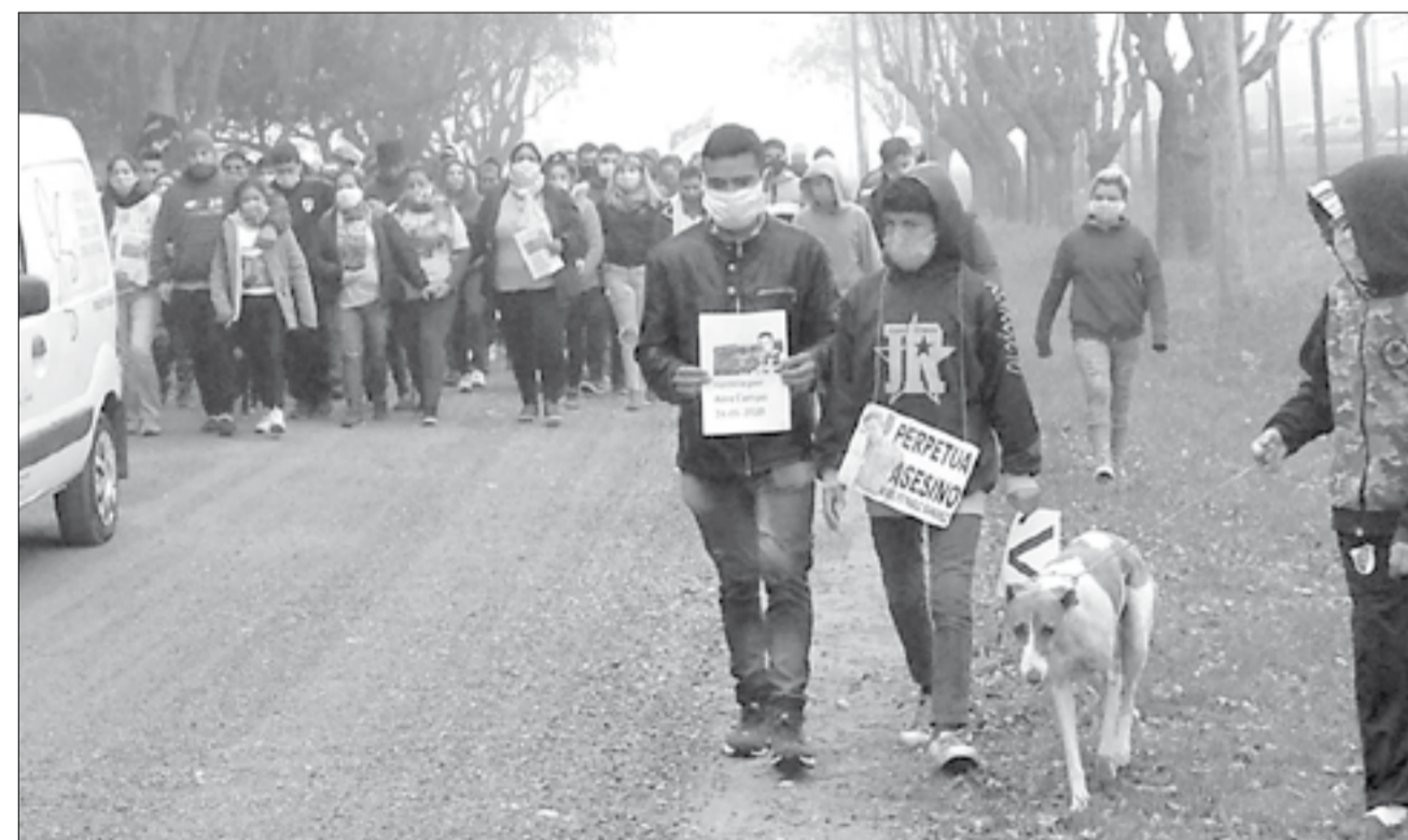
La caravana que escoltó la despedida de Alex.

Al terminar la despedida final la madre del joven se descompuo por lo que debió ser trasladada de urgencia al nosocomio local, donde permaneció con cuidados médicos por varias horas.