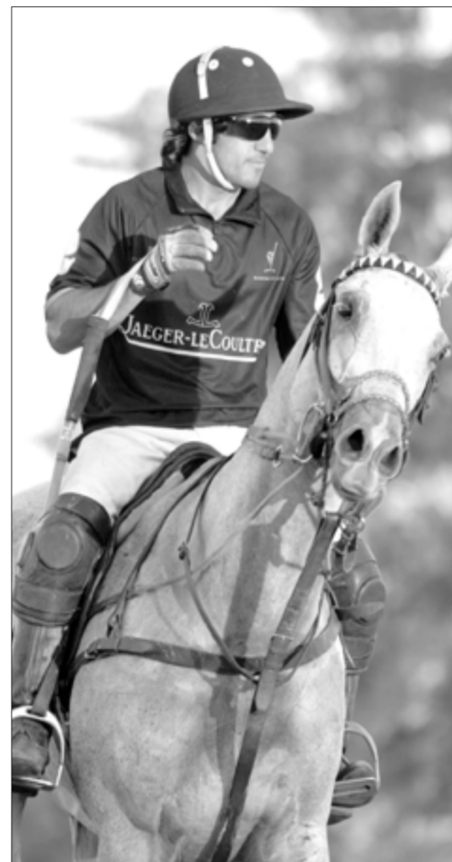
Teves se dedicó a realizar refacciones en su club de polo. cont. en pág. sig.

● Gastón Brambati (fútbol de la C). "Trato de cocinar y dar una mano en casa siempre, aunque admito que en realidad me doy maña con la cocina, y en las