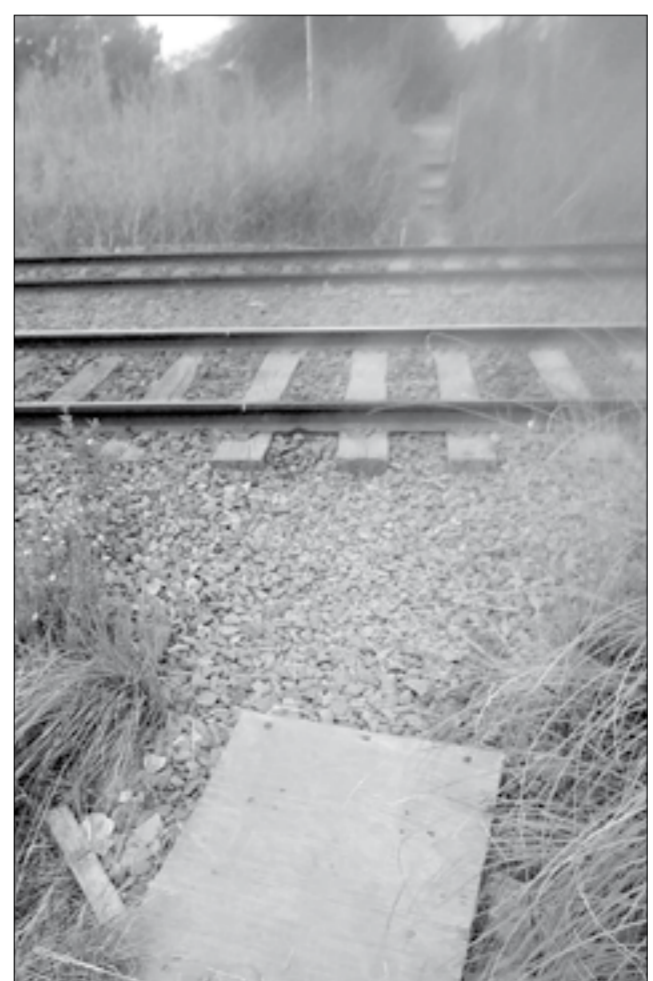
Vecinos quieren soluciones a un reclamo que no es nuevo.

Tal vez surja que es competencia de Vialidad de la Provincia llevar una solución, o de la Comuna. Sin embargo, ya es tiempo de avanzar en una obra.