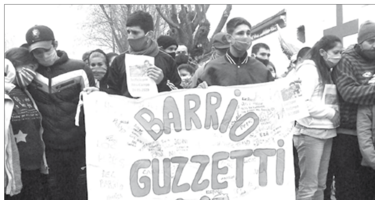
Marcha detenida momentos antes de ingresar al Cementerio Municipal.

Liars directos, seguidos por centenares de cañuelenses apesadumbrados por la trágica muerte. El momento más traumático por los presentes