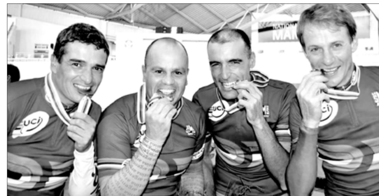
Auge ganó la medalla de Oro en Persecución por Equipos en el Mundial de Manchester, Inglaterra, en 2015.