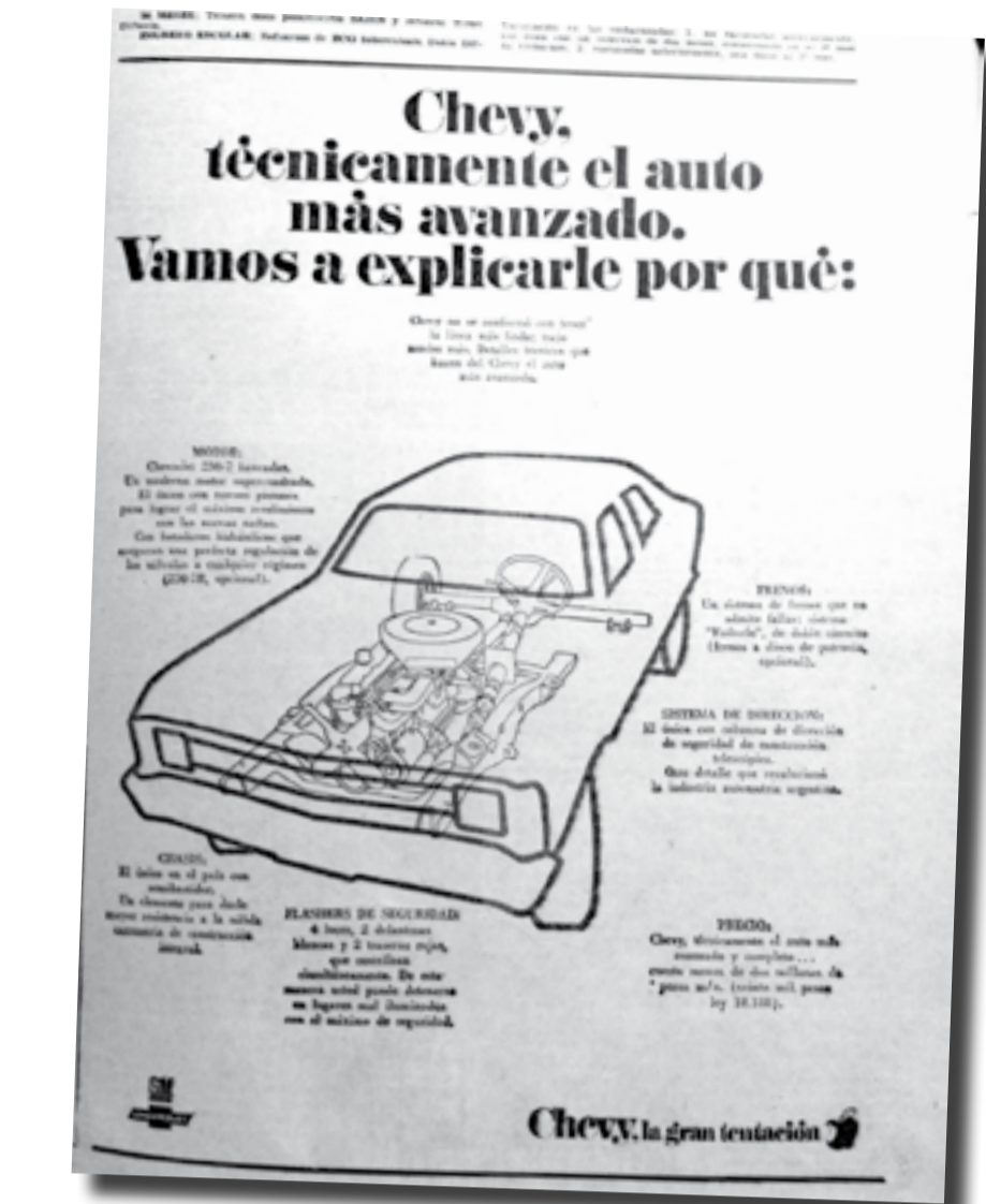
Publicidad en EL CIUDADANO de mayo del año 1970.

● Importante fiesta gaucha en Gobernador Udaondo. Se llevó a cabo para festejar el aniversario por la Revolución de Mayo y fue organizada por la Comisión Pro Sala de Primeros Auxilios y el delegado municipal Mar-