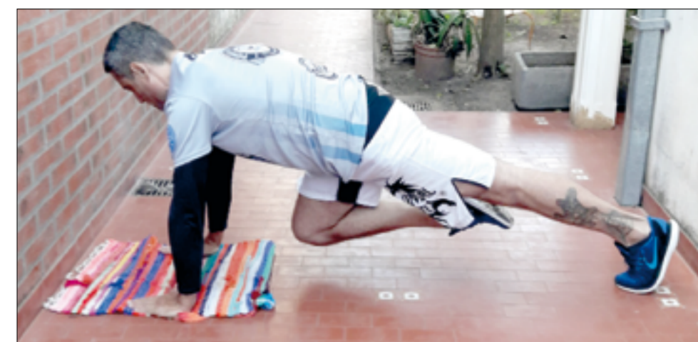
Escaladores o mountain climbers.

Realizar dos o tres series de quince o veinte