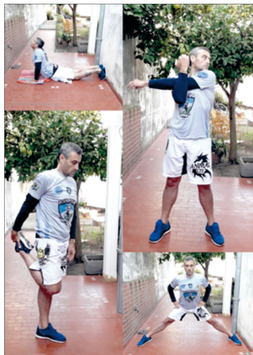
Movimientos básicos para la entrada en calor.

Parece un ejercicio sencillo, pero lo cierto es que