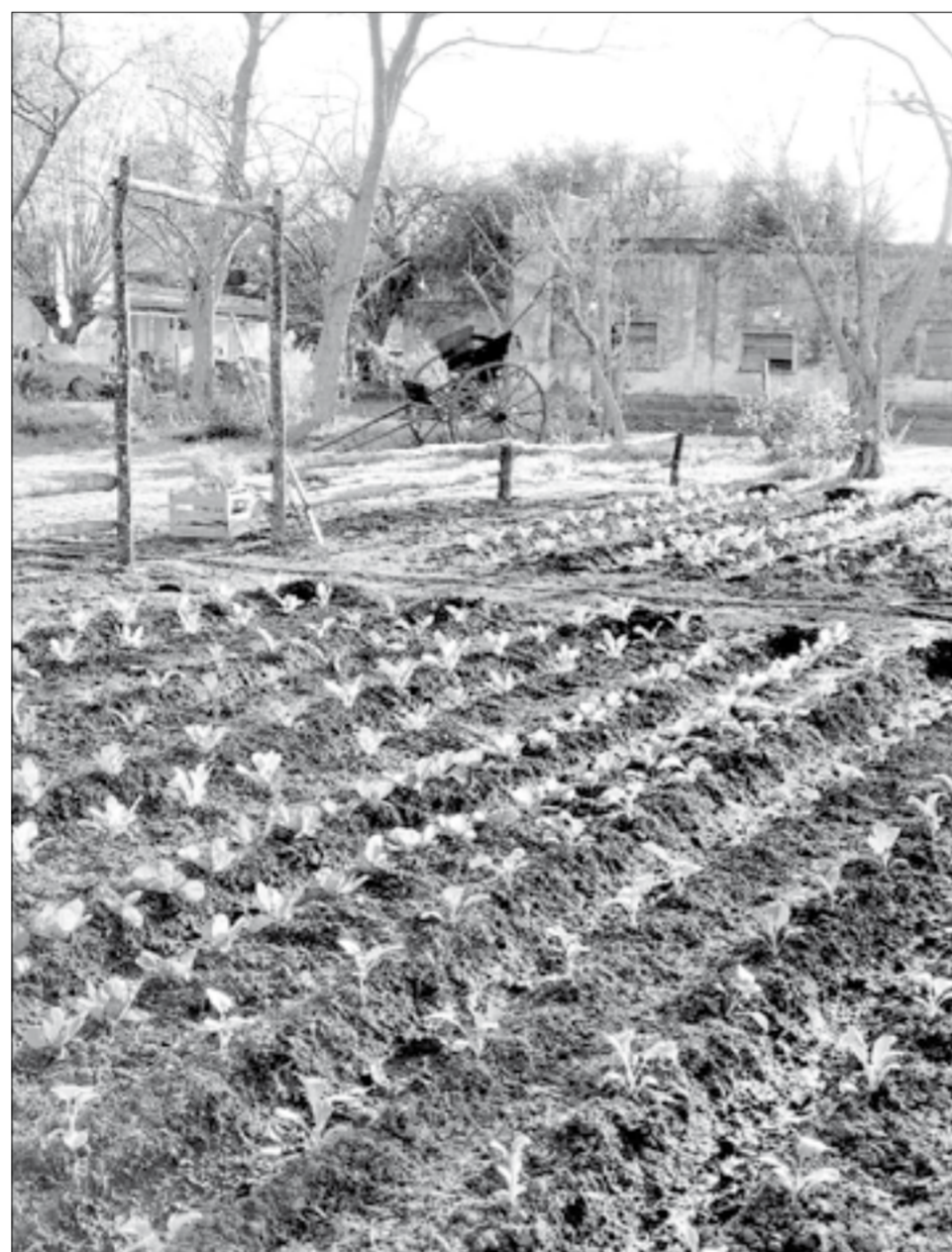
La huerta de ‘El Retoño’ esperando la cosecha dentro de unos meses.