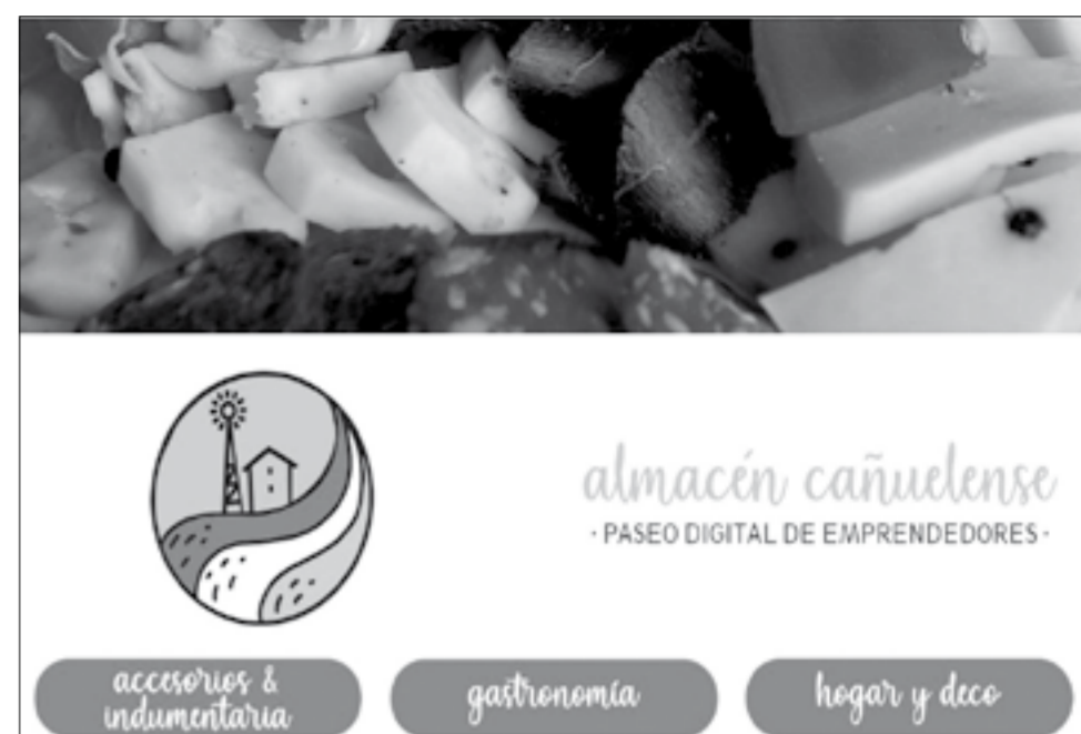
Portada de la plataforma 'Almacén Cañuelense'.