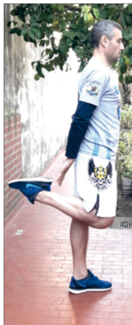
Skipping o repiqueteo.