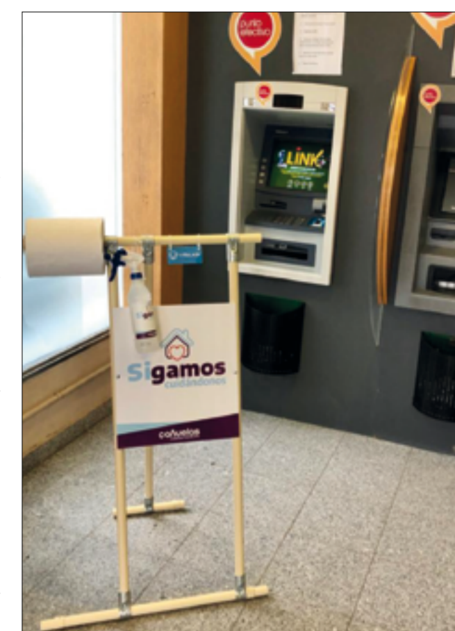
Los dispositivos fueron donados por la empresa Visuar-Samsung.