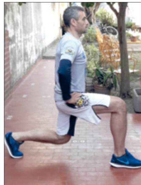
Estocadas o lunges.

lo que pueda parecer un juego de niños ayudará a trabajar todos los músculos del cuerpo, quemar calorías, desarrollar tus reflejos y mantener el equilibrio. Se trata de una de las mejores maneras de hacer "cardio" en casa.