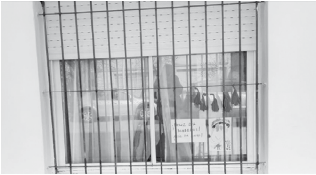
A partir de la pandemia, vecinos y familias homenajearon de otra manera a los servidores con dibujos, globos y cintas rojas.