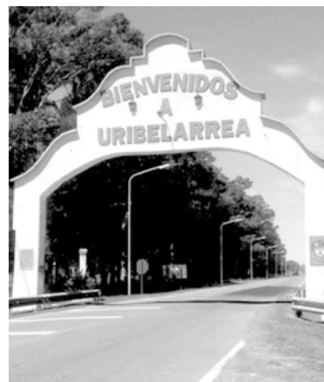
El conflicto entre la Asociación Turística de Uribelarrea (ATU) y la Cooperativa Eléctrica Carboni sigue vigente.

Para acceder al beneficio hay que estar al día con el pago de la tasa referida al 31 de marzo de 2020. Para los que tienen deudas se requerirá la presentación de una declaración jurada donde efectúen un reconocimiento y accedan a la suscripción de un plan de pagos con vencimiento en el primer trimestre de 2021.