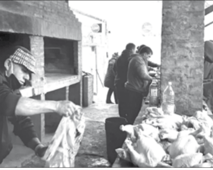
Fueron numerosas las manos solidarias que se sumaron en esta ocasión para ayudar los más necesitados.