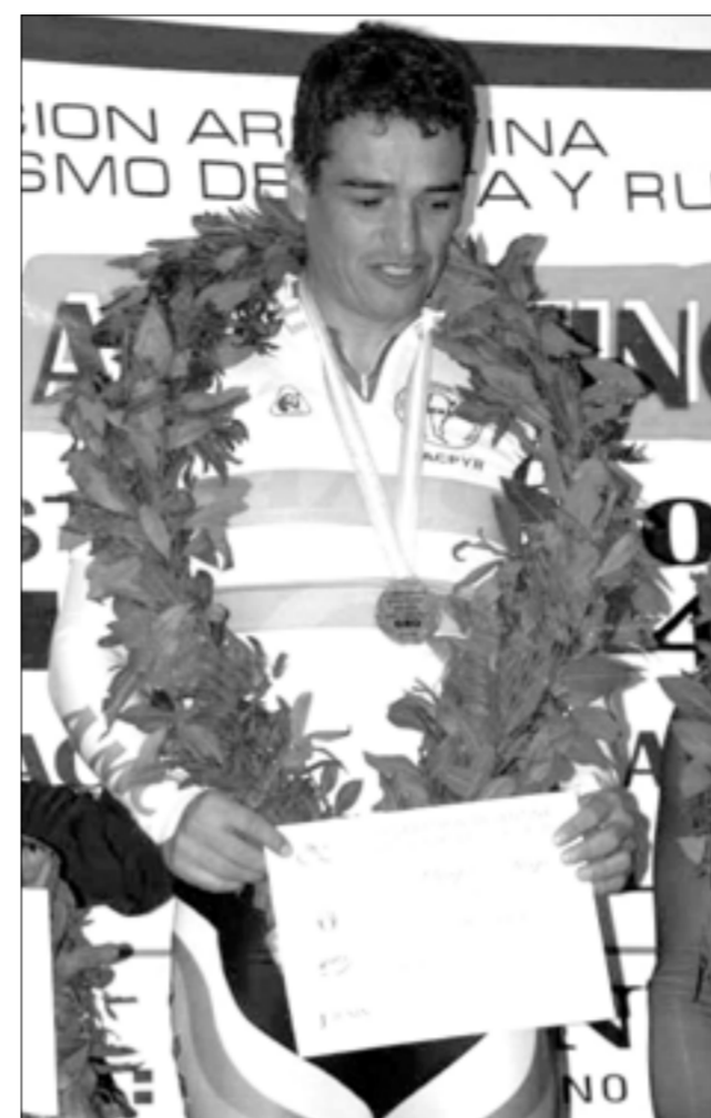
Campeón Argentino de Pista (750 metros). Junín 2014.