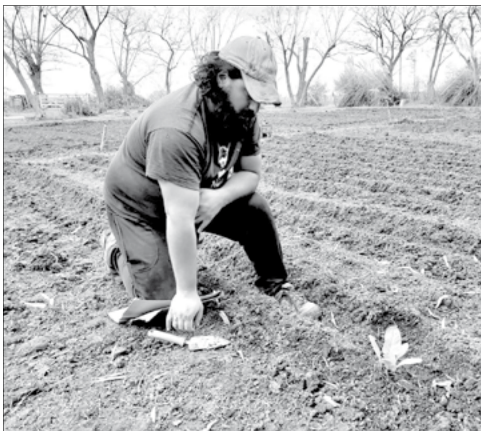
No se utilizarán pesticidas o químicos para forzar el crecimiento de la siembra.

Bajo esta consigna se comunicaron mediante Instagram con los productores agroecológicos para pedirles que preparen un video corto para relatar parte de su historia y actividad.