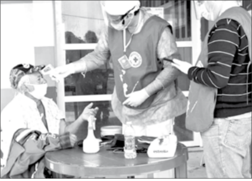
La organización no gubernamental de carácter internacional Médicos del Mundo participó de la jornada de atención primaria de la salud realizada en la localidad.