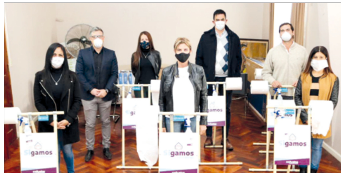
Los dispositivos para higiene y desinfección personal fueron entregados para ser colocados en los cajeros automáticos.

Por medio del Decreto 0325/2020, el Departamento Ejecutivo eximió a los contribuyentes relacionados con las actividades de taxis y remises particulares del pago de la