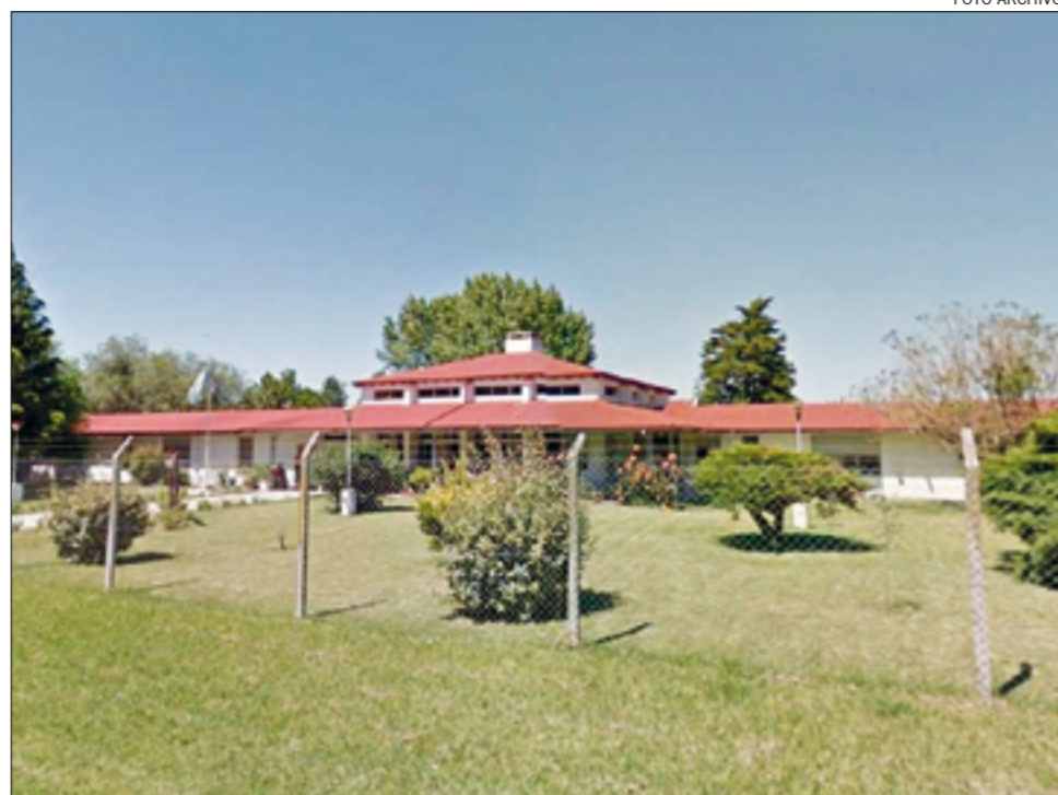
Cañuelas cuenta con tres residencias de adultos mayores, el asilo 'San José' y dos privadas.