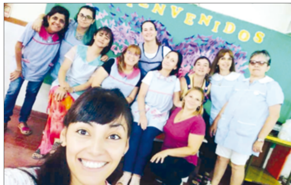
Docentes turno mañana.

En primer lugar se organizaron pequeños grupos de whatsapp entre las maestras y los padres. Luego se subieron videos explicando las actividades de la jornada