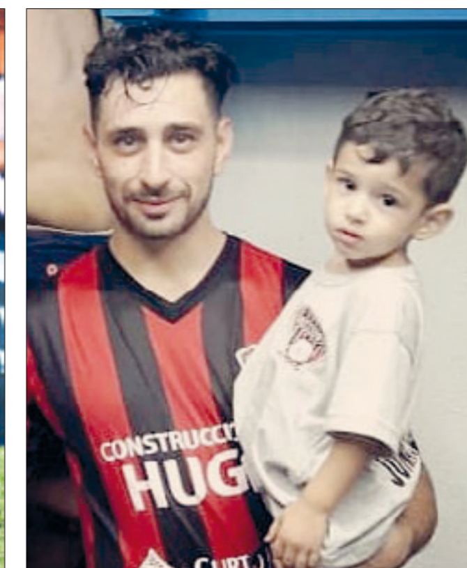
Montovio: jardinería, pintura y tiempo compartido con los hijos.