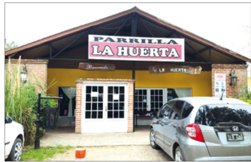
Desde La Huerta reclaman alguna medida para apoyar su sector gastronómico.

Desde hace años que se consagró con un espacio en el corredor de Ruta 205 al tener una aprobación con sus comidas. El restaurante ‘La Huerta’ hoy luce quieto, sin su chimenea humeante, con espacio para cualquier vehículo a partir de la pandemia del coronavirus.