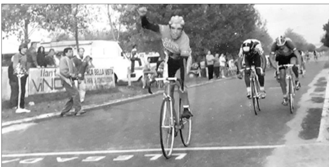
Tercera carrera ganada en forma consecutiva en Bella Vista (1993).