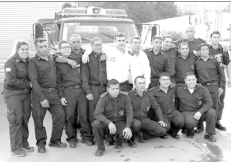
Cuerpo activo de Bomberos Voluntarios de Alejandro Petión.

Feliz día a cada uno de ellos y al querido cuartel de Alejandro Petión.