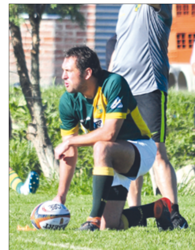
Penna: "Intenté hacer pan pero fracasé".