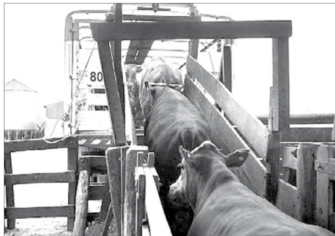
El Ministerio de Desarrollo Agrario de la Provincia de Buenos Aires decidió la prórroga hasta 30 de junio.

"Ante la inminencia del vencimiento -fijó el ministerio Agrario- de las prórrogas estipuladas en las resoluciones referidas, la Subsecretaría de Agricultura, Ganadería y Pesca de este Ministerio, conjuntamente con las Direcciones Provinciales de Ganadería y de Pesca bajo su dependencia, decidieron extender el plazo de las mismas hasta el 30 de junio de 2020 inclusive".