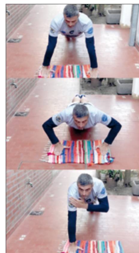
Flexiones o push-ups.

viene de pág. ant. peso del cuerpo repartido entre ambos. Espalda derecha y brazos sueltos a los lados del cuerpo.