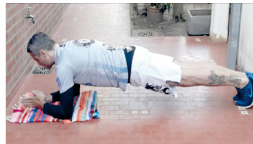
Plancha o planks abdominales.