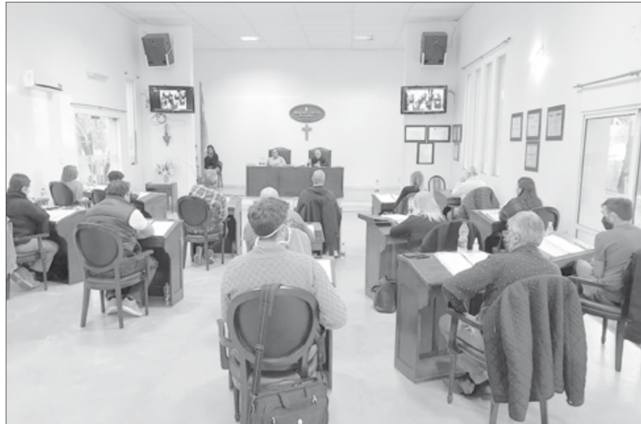
De manera inédita utilizaron más de dos horas para las cuestiones de privilegio.

Otro largo espacio llevó la lectura de los proyectos a sancionar durante la sesión. Resulta que fueron llevados a comisión por la imposición del oficialismo. Juntos por el Cambio pidió leer cada una de sus iniciativas. Lo que provocó una discusión entre los presidentes de las bancadas del Frente de Todos y de Juntos por el Cambio. Para este año todo indi-