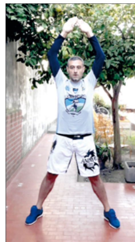
Jumping jacks o angelitos.