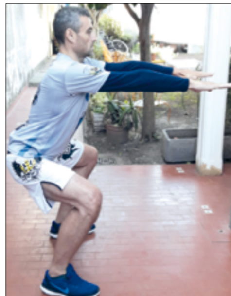
Sentadillas o squats.